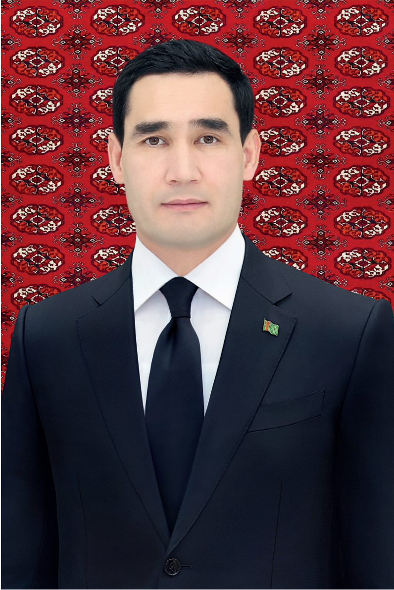
TÜRKMENISTANYŇ PREZIDENTI SERDAR BERDIMUHAMEDOW